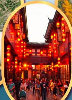
ถนนโบราณจิ้นหลี่