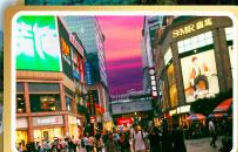
ถนนคนเดินซุนชู่