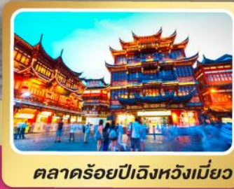
ตลาดร้อยปีเฉิงหวังเหมียว