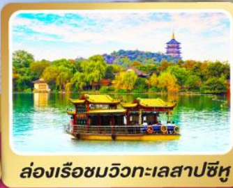
ล่องเรือชมวิวกะเลสาปซีหู