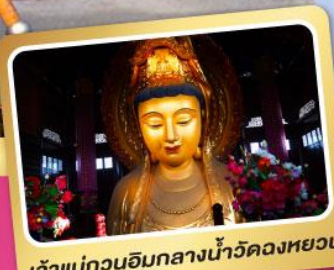
เจ้าแม่กวนอิมกลางน้ำวัดหลงหยวน